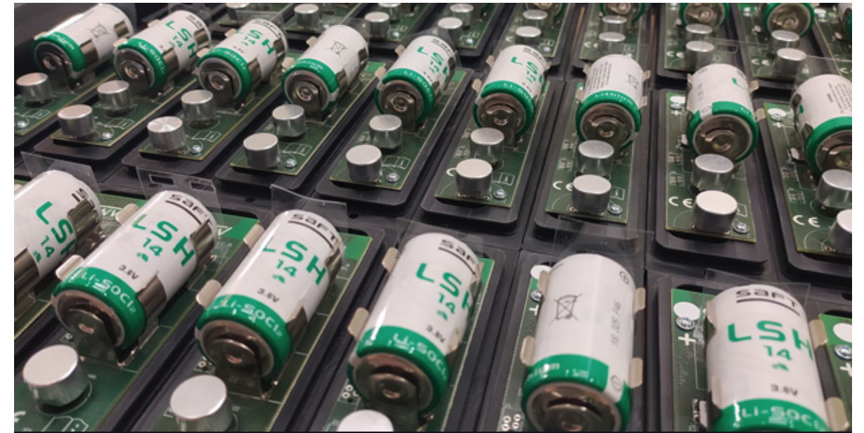
Αισθητήρες Στάθμης Δεξαμενών Πετρελαίου